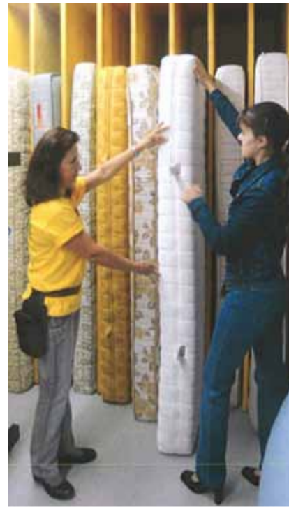
Richtig gelagerte Matratzen