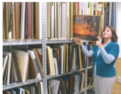
Bilderrahmen sind begehrte Artikel