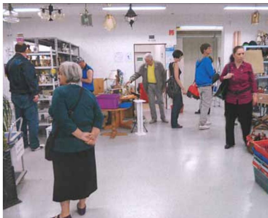
Onkel Toms Brocki lebt: Bis zu 200 Besucher täglich