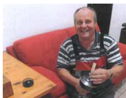
Die Petrollampe funktioniert!