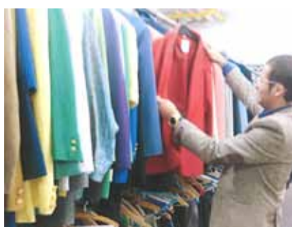
Praktisch neuwertige Kleider