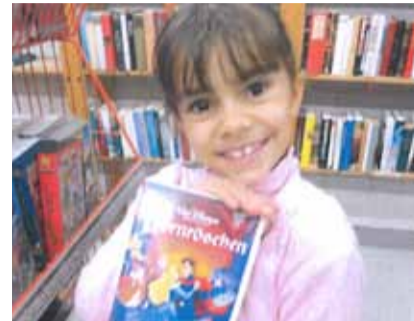
Eine Fundgrube auch für Kinder